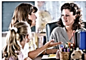
ЧОУ ДПО "Национальный центр деловых и образовательных проектов"